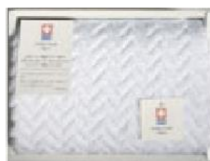
<ウェーブ(認定マーク品)>

<取扱い開始記念キャンペーンチケット> 対象：平成28年7月～12月注文分 通常はPP袋包装ですが本用紙の提示で『1枚ずつ箱に入れてお納め』します。 申込みの際、必ずこのチケットをご提示下さい。