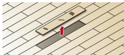
1枚単位の施工も可能です

実(さね)がない形状で、下地への釘打ちや接着剤の塗布がないため、1枚単位での貼り替えや施工前の状態への原状回復が容易に行えます。また、製品寸法は150mm×900mmと非常にコンパクトで、梱包重量は約6kg/梱(1.62㎡)と、持ち運びも楽に行えます。