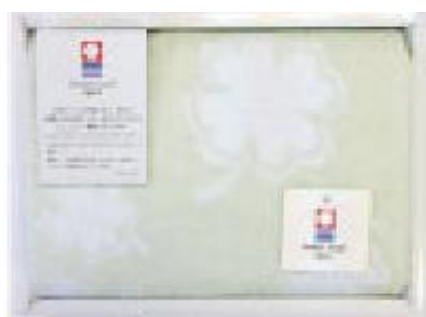
<クローバー(認定マーク品)>