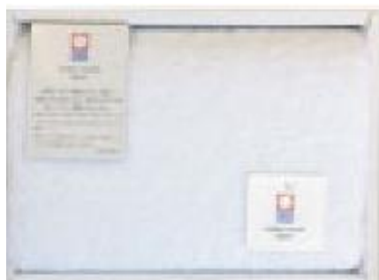
<白無地(認定マーク品)>